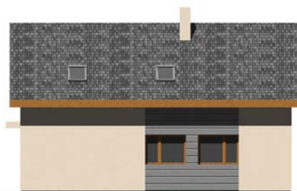
POHLED BOČNÍ (KUCHYNĚ)